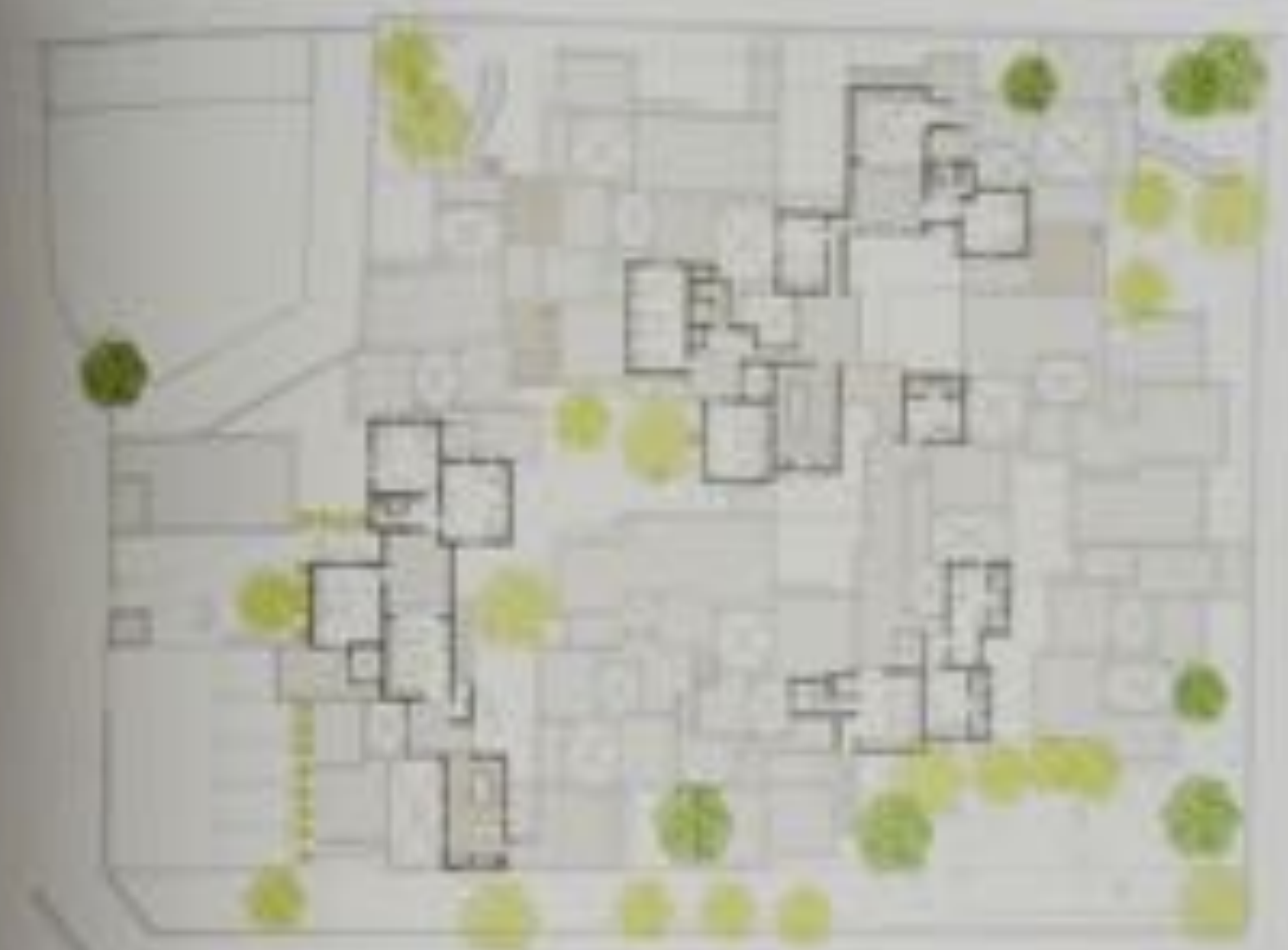
Site plan diagram