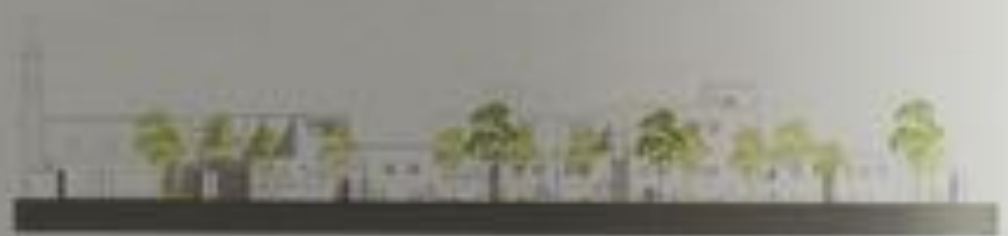
Section through the building facade