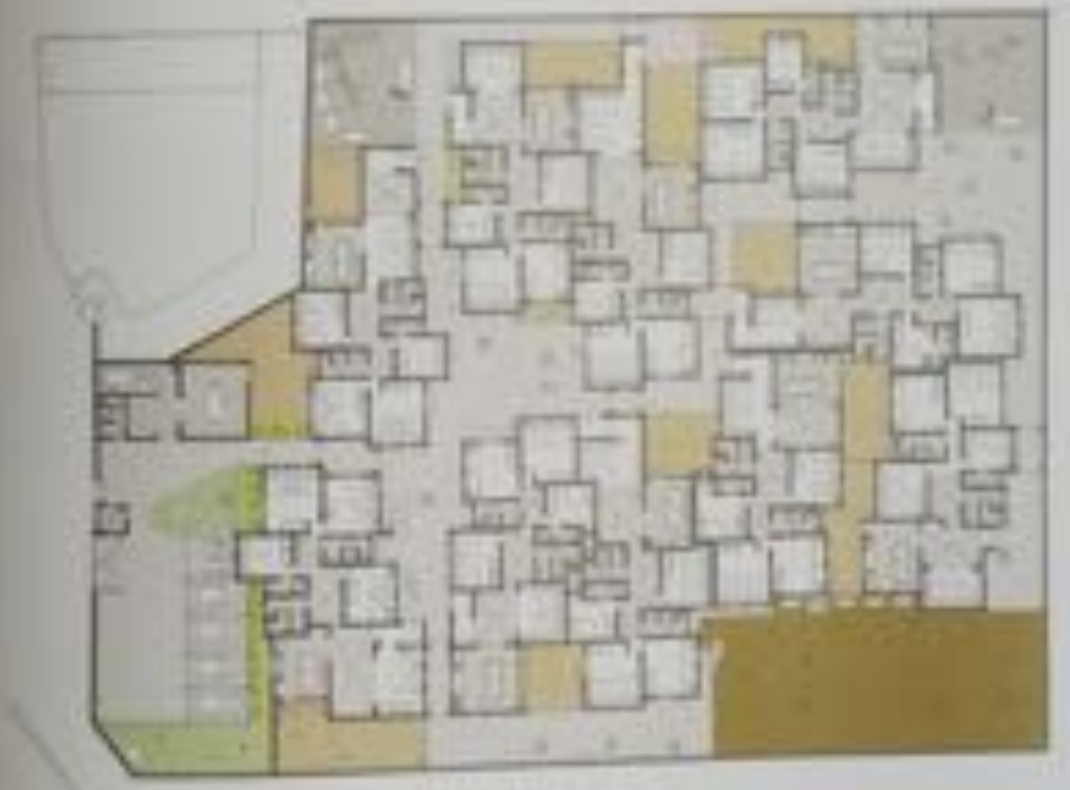
Site plan diagram