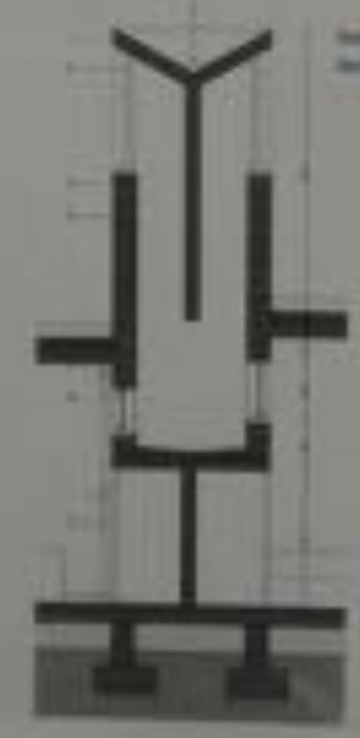
Section through the building facade